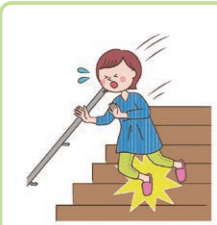
階段から転落して骨折した。