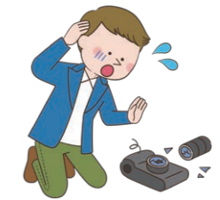
旅行先でカメラを落とし壊してしまった。