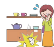
買い物中に商品を壊した。