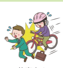
仕事や通勤途中のケガで通院した。