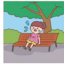
外出中に熱中症で倒れ、そのまま入院した。

「ケガの補償」では補償の対象外となっている日射または熱射による身体の障害に対しても保険金をお支払いします。