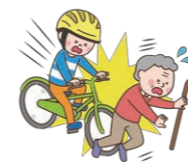
自転車で走行中、歩行者にケガを負わせた。

日常生活におけるさまざまな法律上の損害賠償責任を補償します。近年進んでいる自治体による自転車保険加入義務化にも対応可能です。