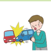
交通事故によるケガで入院した。