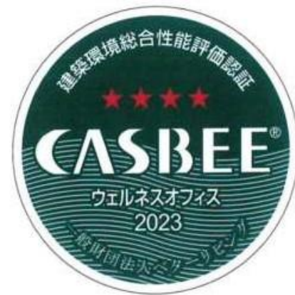
【CASBEEウェルネスオフィス】