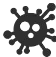
所定の感染症に罹患