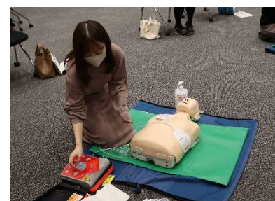
〔救命講習会の様子〕

当社はこれからも従業員に対する救急救命の知識の周知に努めるとともに、誰もが安心して元気に長生きできる社会の実現を目指してまいります。